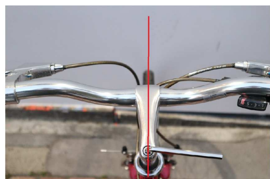
⑥ステムとタイヤを垂直に合わせる