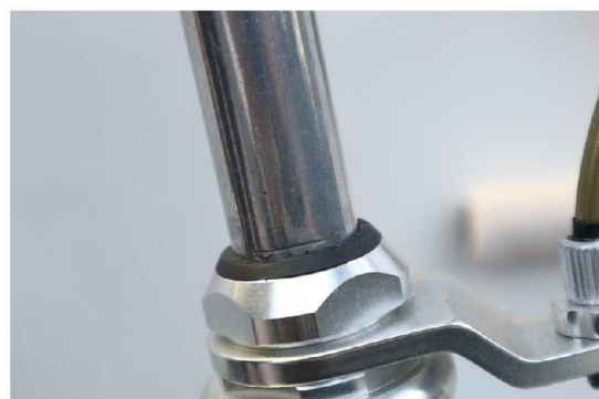
④マックスラインに合わせてます