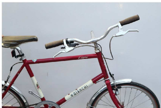
①商品が届きダンボールから出した状態