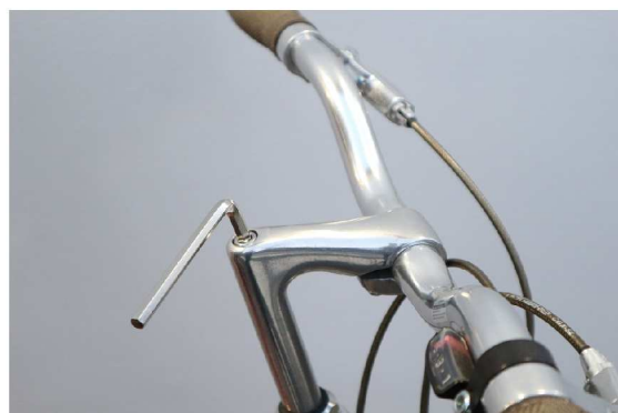
⑤ステムのボルトに六角レンチを合わせる