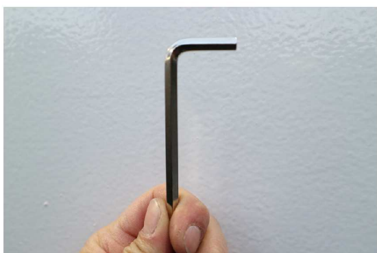
②付属の六角レンチを用意します