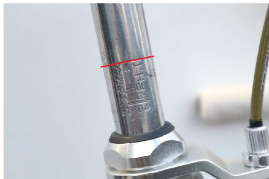
③ハンドルステムのマックスラインを確認