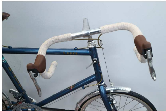
①商品が届きダンボールから出した状態