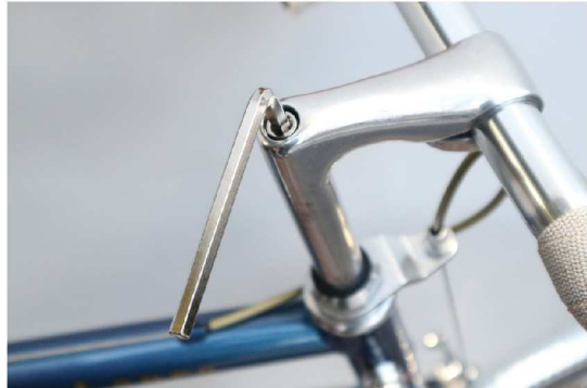
⑤ステムのボルトに六角レンチを合わせる