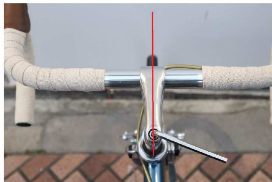
⑥ステムとタイヤを垂直に合わせる